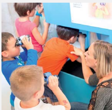
Voir avec des jumelles