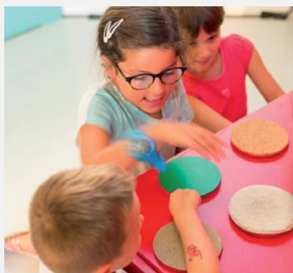
Le toucher