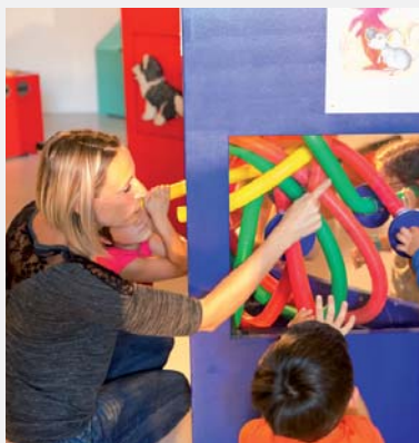
L'expo à entendre