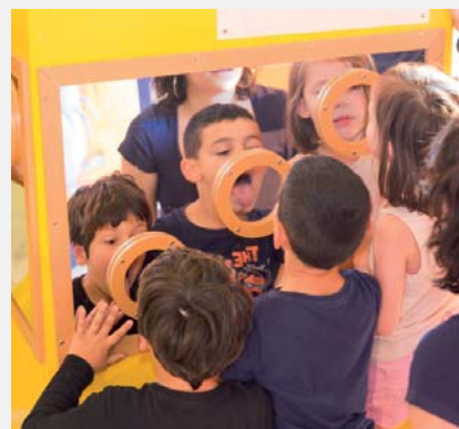
Le miroir des déformations