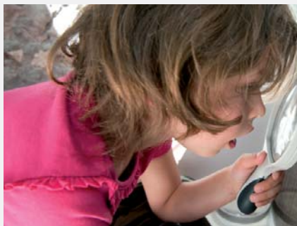
L'Expo à voir