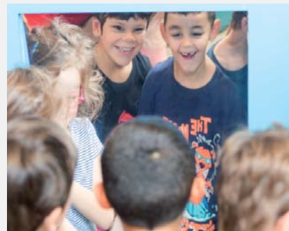
Le miroir des déformations