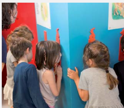
Que voit-on par le trou d'une serrure ?