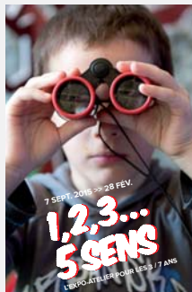
Visuel de l'exposition 5 SENS

Toutes les photos proposées sur cette page sont libres de droit et soumises à la mention indiquée pour chaque visuel. Merci de respecter le droit des auteurs de ces prises de vue en les citant pour chaque publication (print et/ou web).