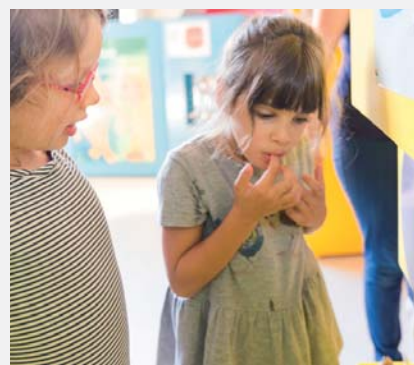
Gouter... salé ? sucré ?